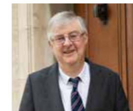
Mark Drakeford MS, Primul ministru al Țării Galilor