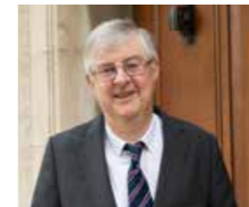
Mark Drakeford MS, 威尔士首席部长