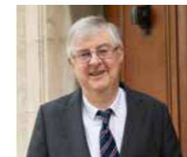
Mark Drakeford MS, Premier Ministre du Pays de Galles