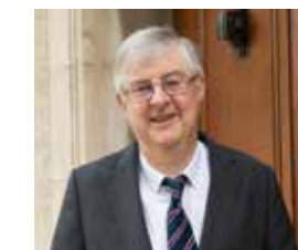
Mark Drakeford MS, První ministr Walesu