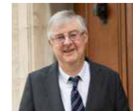
Mark Drakeford MS, Kryeministri i Uellsit