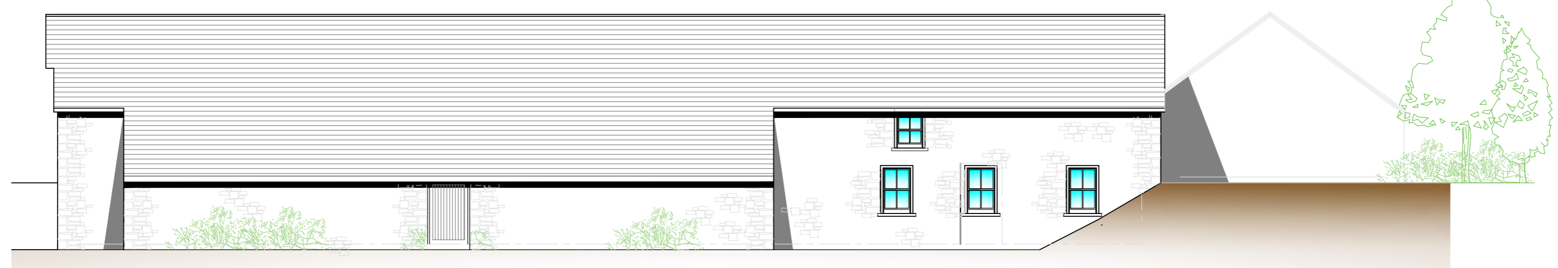
Ysgubor 'A' – Wyneb i'r Gogledd Gorllewin