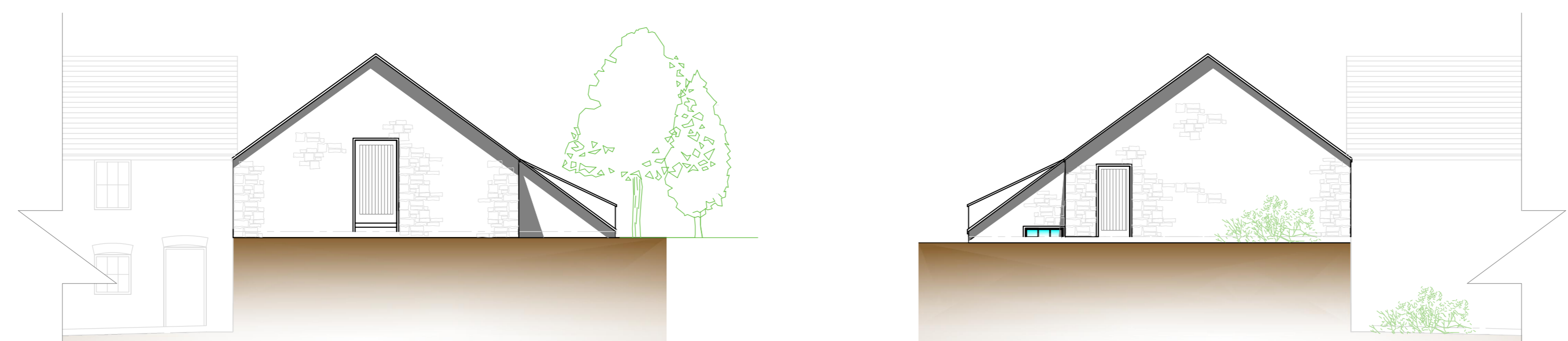
Ysgubor 'A' – Wyneb i'r Gogledd Dwyrain