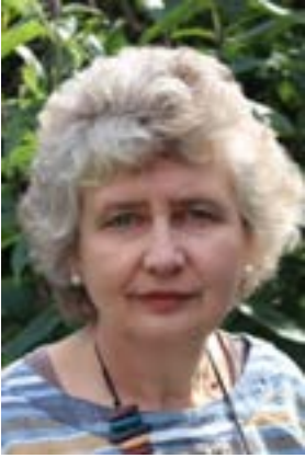
Meinir Pritchard Pennaeth y Gwasanaeth Cyfieithu

Diolch ichi am eich diddordeb yng Ngwasanaeth Cyfieithu Llywodraeth Cymru. Dyma gynnig ichi ddarlun o'r Gwasanaeth Cyfieithu, ei gylch gwaith a'r ffordd y bydd yn cyflenwi gwasanaethau cyfieithu i gefnogi Gweinidogion Cymru.